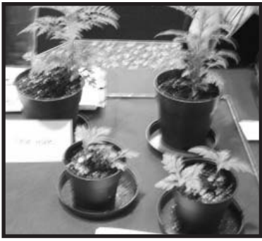
Salaberry de Valleyfield.

Dans notre dernière édition Verdure numéro 2 2007, nous vous présentons les grandes lignes du plan d'action concerté 2007-2010 de contrôle de l'herbe à poux (HAP) à